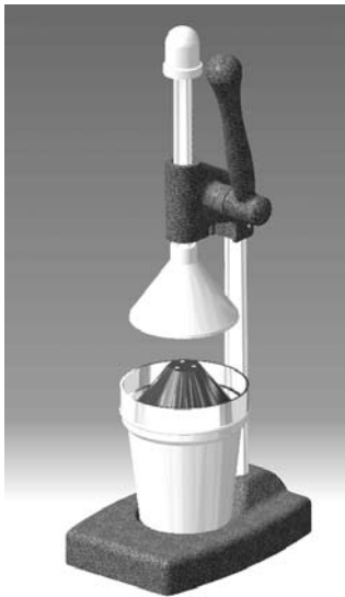
Bild 2 Zusammenbau der Zitruspresse

Es wurden zuerst die Grundbegriffe der 3D-Modellierung erläutert, CATIA-Bedienung und -Oberfläche vorgestellt. Nach vorbereitenden Übungsbeispielen wurden aus technischen Zeichnungen zuerst die Bauteile einer Zitruspresse /2/ , danach die Zusammenbauzeichnung erzeugt ( Bild 2 ).